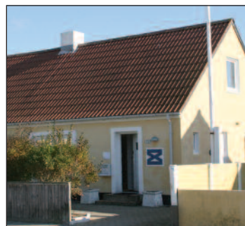
og Metalhuset i Skagen.