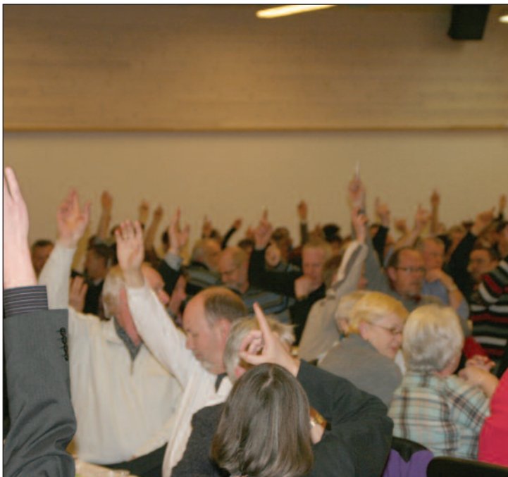
Der var enstemmig tilslutning til beretningen på 3Fs generalforsamling.