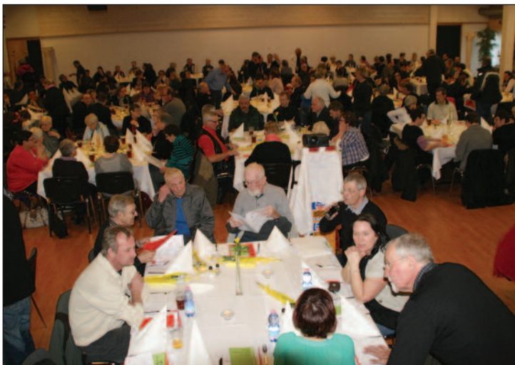
Næsten 300 deltog i generalforsamlingen inklusive 15 medlemmer på Læsø.