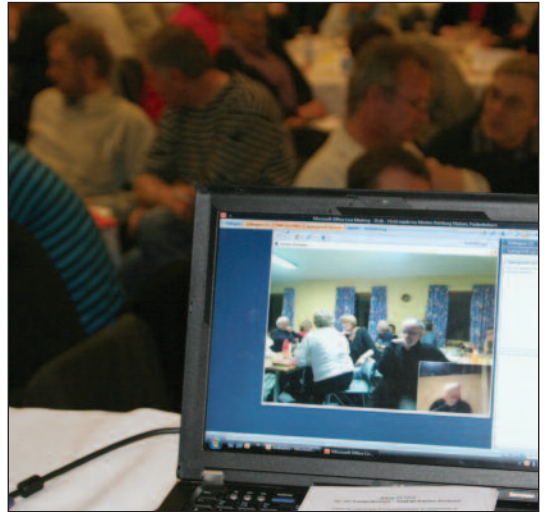
15 medlemmer på Læsø kunne følge med i generalforsamlingen. Men teknikken svigtede lidt.