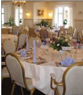
Dronninglund Hotel venter gæster fra LO Frederikshavn. Vil du med?

19. april kl. 18.00-23.00 på Centret på Ingeborgsvej er der forårsfest sammen med Skagen Pensionist og Efterlønsklub. Billetter sælges 7. og 14. april. Pris 150,00 kr. for medlemmer og 200,00 kr for ikke-medlemmer. Der serveres to retters menu. Musikken leveres af Løjbjerg Harmonika Klub.