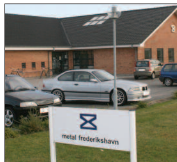
Det samme gælder Metalhuset i Frederikshavn.